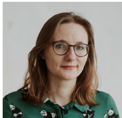
LISA BADUM Bundestagsabgeordnete, 36 Jahre, geb. in Forchheim

Seit 2017: Sprecherin für Klimapolitik der Grünen Bundestagsfraktion